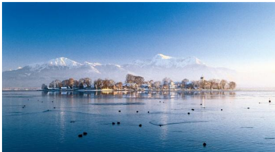
Prien Marketing GmbH

Heute fahren wir nach Salzburg, wo Sie die Möglichkeit haben, das beeindruckende „Salzburger Adventsingen“ im Großen Festspielhaus mizuerleben. Jährlich besuchen über 36.000 Menschen aus aller Welt diese besinnliche Veranstaltung mit über 150 Mitwirkenden. Sie können über den Christkindlmarkt schlendern und in den festlich geschmückten Geschäften und Gassen Weihnachtseinkäufe machen. Wer lieber in Bad Endorf bleibt, kann einen ganzen Tag in der „Chiemgau Therme“, die direkt gegenüber unseres Hotels liegt, verbringen. Hotelgäste erhalten vergünstigten Eintritt.