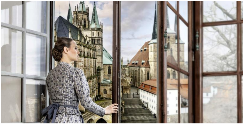
Oper in vier Bildern von Giacomo Puccini

Libretto von Giuseppe Giacosa und Luigi Illica nach den Scènes de la vie de bohème von Henri Murger In italienischer Sprache mit Übertiteln