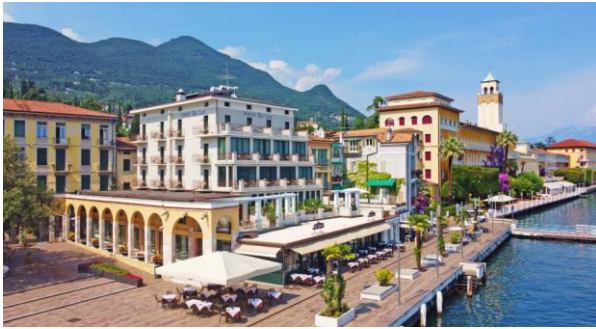
Hotel Du Lac